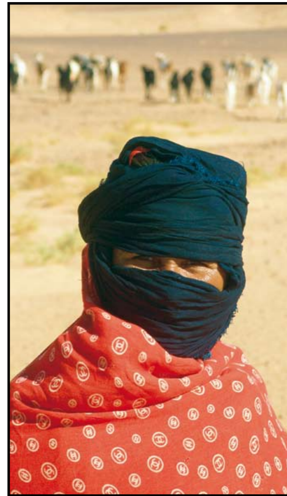
Kamel- og geitehold er viktigste næringsvei for de saharawiske nomadene.