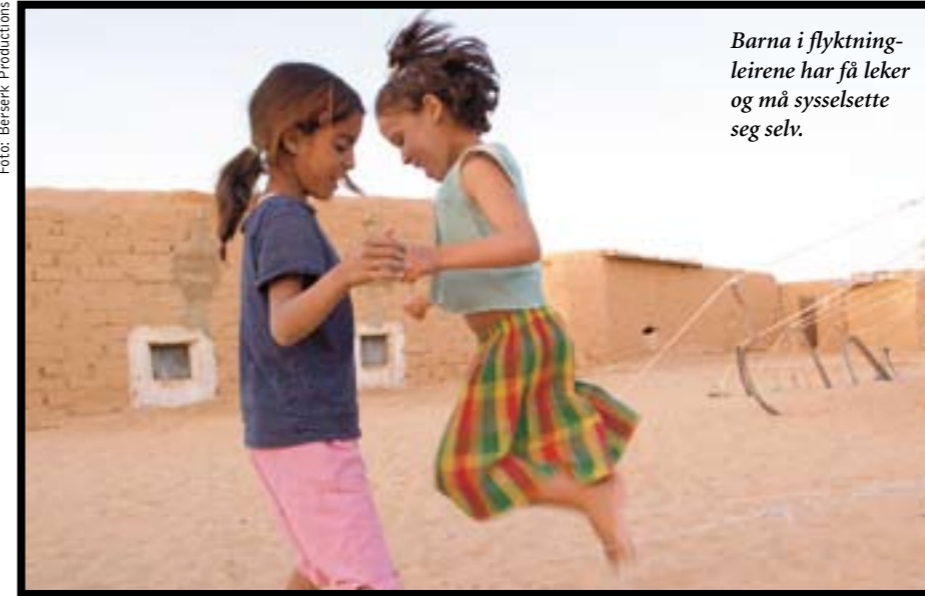
Barna i flyktningleirene har få leker og må sysselsette seg selv.

ningene sørger selv for distribusjonen av bistand, og står for all administrasjon, skolevesen og helsevesen. Det finnes praktisk talt ingen kriminalitet.