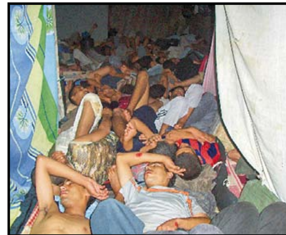
Fra innsiden av det marokkanske «svarte fengselet» i den vest-sahariske hovedstaden El Aaiun, hvor de fleste saharawiske politiske fangene holdes.