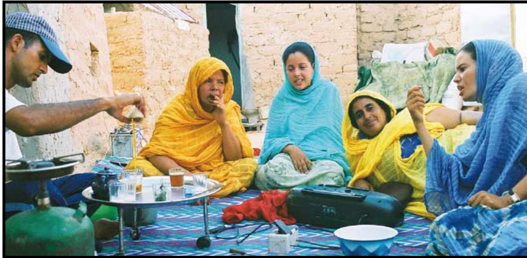
Det saharawiske te-ritualet er viktig i flyktningenes hverdag.

KREVER INNLEMMEELSE Saharawiene er blitt lovet en folkeavstemning som skal avgjøre deres egen fremtid. Mer enn 100 FN-resolusjoner og Den internasjonale domstolen i Haag (i 1975) slår fast at saharawiene har