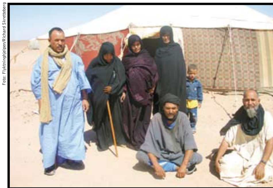
Et lite antall saharawiske nomader lever fremdeles i de Polisario-kontrollerte delene av Vest-Sahara.

FLYKTINGENE Flyktingenes humanitære situasjon forverres stadig. ØSK åpner for at utviklingsland til en viss grad kan prioritere egne borgere, men Flyktingkonvensjonen av 1951 inneholder også sosiale og økonomiske minimumsstandarder for flyktinger. Asyl landet Algerie må overholde sine forpliktelser etter de grunnleggende menneskerettighetskonvensjonene og Flyktingkonvensjonen av 1951 som landet er part til. Medlemsstater til menneskerettighetskonvensjoner er forpliktet til å respektere og fremme rettighetene til alle mennesker