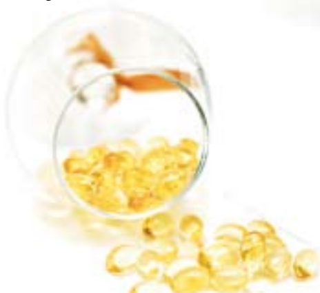
Fiskeolje fra Vest-Sahara havner i Omega 3-kapsler over hele verden, også i Norge.

Amnesty International har notert en viss forbedring i menneskerettighetenes kår i Marokko de siste årene, men påpeker at det ikke gjelder for de delene av Vest-Sahara som er okkupert av Marokko. «Her er situasjonen langt mer kritisk», skriver de i sin «Landprofil: Marokko og Vest-Sahara». ■