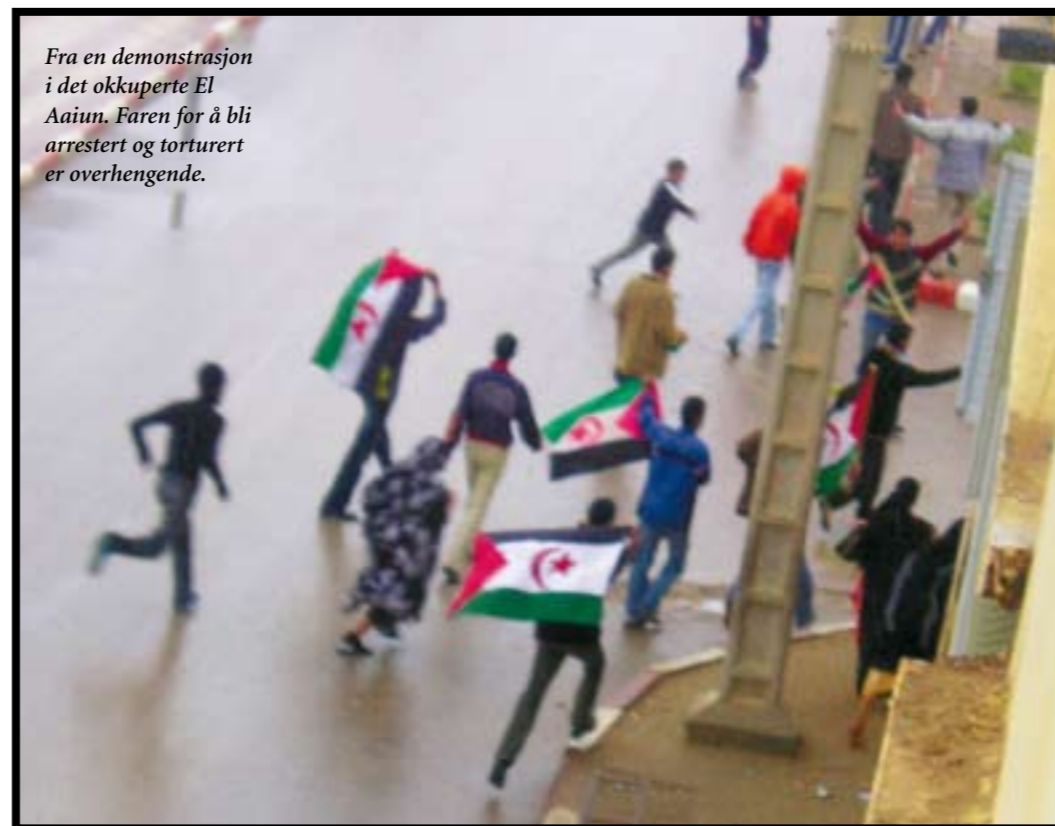
Fra en demonstrasjon i det okkuperte El Aaiun. Faren for å bli arrestert og torturert er overhengende.

«Marokko har i en årrekke, til tross for sterk fordømmelse fra FN, okkupert Vest-Sahara. Kerr-McGee legger etter rådets vurdering til rette for Marokkos mulige utnyttelse av naturressursene i området. Rådet anser slik virksomhet som et 'særlig grovt brudd på grunnleggende etiske normer' blant annet fordi dette kan bidra til å legitimere Marokkos suverenitetskrav og dermed undergrave FN's fredsprosess.» uttalte Finansdepartementet den gangen 25 . Selskapet mistet etter hvert flere andre aksjonærer inntil de i 2006 offentliggjorde at de ikke lenger ville fortsette sine aktiviteter i Vest-Sahara. ■