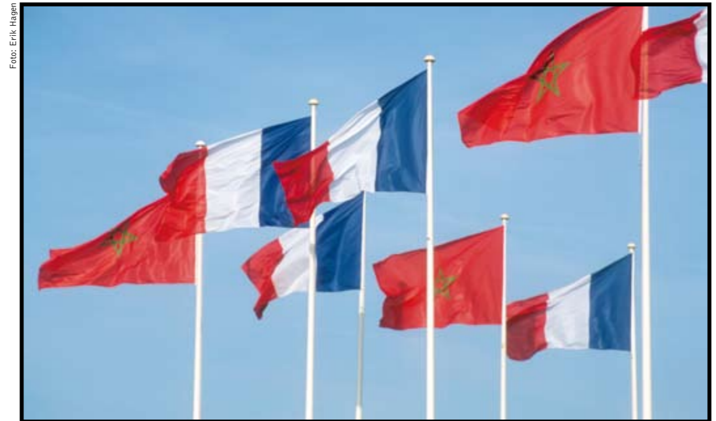
De tette båndene mellom Marokko og Frankrike beskytter okkupanten mot nødvendig press.

Med den fransk-spanske støtten til Marokko har EU blitt fullstendig handlingslammet i forhold til å legge politisk press på okkupanten. Saharawi- vennlige land som