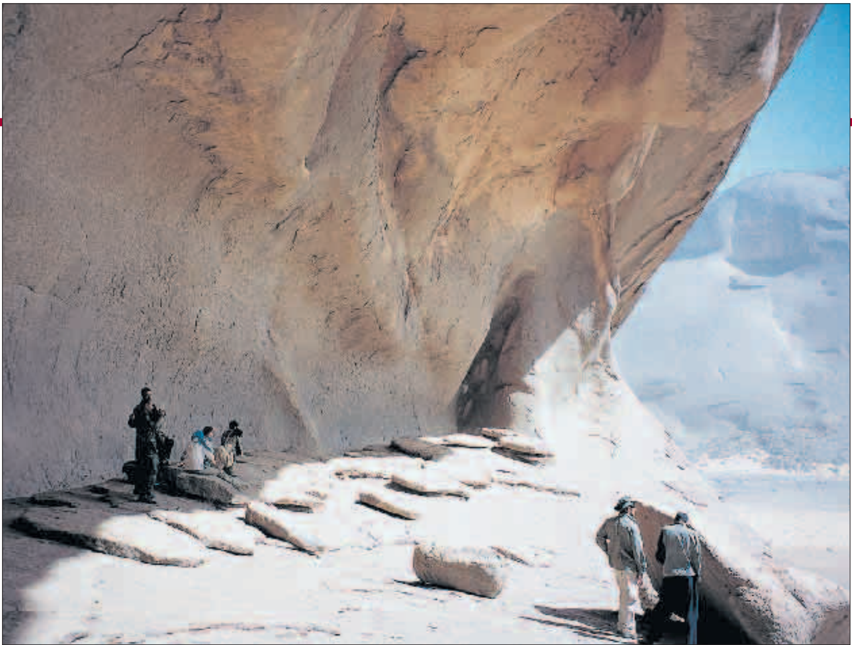
Ekspeditionen fandt også mange hulemalerier på deres rejse. Her er gruppen nået til Le Juad Cave.