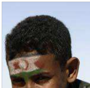
VETERAN: En saharawisk flyktning i leiren Dakhla ved Tindouf sørvest i Algerie.

MAÑANA, MAÑANA: Den tidligere kolonimakten Spania er også unnfalende overfor Marokko. Spanjolene vil ha et godt forhold til landet, blant annet for å kunne samarbeide effektivt for å stanse flyktningstrømmen fra Afrika til Spania og resten av EU. Frankrike på sin side har også et nært forhold til Marokko, og også store økonomiske interesser i landet. Resultatet av er at landene i FNs sikkerhetstråd ikke blir enige om å presse