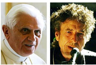
Pave Benedikt 16. (t. v.) vil nok aldri invitere Bob Dylan til Vatikanet.

Det har blant andre Nobelprisvinneren i litteratur Orhan Pamuk smertelig fått erfare.