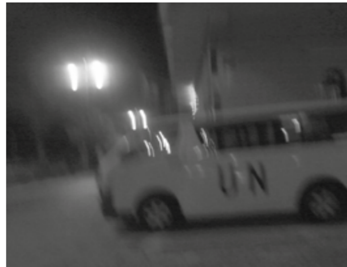
Det er natt, og FN-personell kjører rundt i Vest-Saharas hovedstad i sine hvite FN-biler. Når de er vitne til et overgrep, forteller de det ikke til sjefene sine i New York.

Alle moderne FN-operasjoner i verden har i oppgave å dokumentere overgrep de er vitne til. Deretter rapporterer de tilbake til FNs hovedkvarter i New York. På den måten kan FNs Sikkerhetsråd følge opp konfliktene og sine operasjoner basert på troverdige kilder.