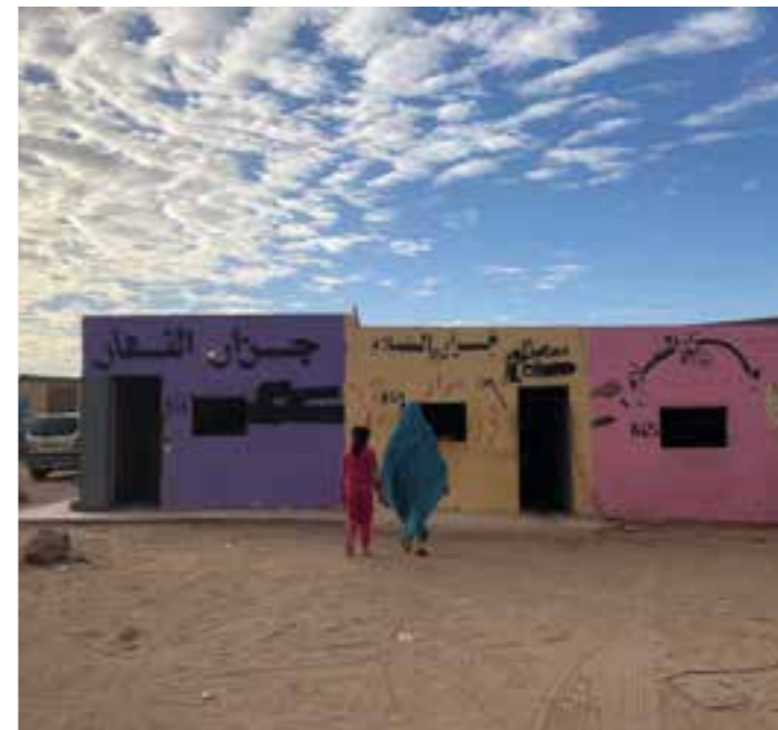
Alle mener at Sikkerhetsrådet må endres. Man klarer bare ikke bli enige om hvordan. I mellomtiden vokser en ny generasjon opp i flyktningleirene i Algerie.

Mangelen på veto-debatt forsvares av og til gjennom statistikk som viser at vetoretten sjelden har blitt brukt siden den kalde krigens slutt. Å vise til denne statistikken vil være misvisende siden mange spørsmål aldri blir fremmet i Sikkerhetsrådet hvis det er grunn til å vente at et av landene vil legge ned veto. I Vest-Sahara-saken løses for eksempel alle saker på bakrommet av den såkalte ‘vennegruppen’, før det i det hele tatt legges fram i Sikkerhetsrådet.