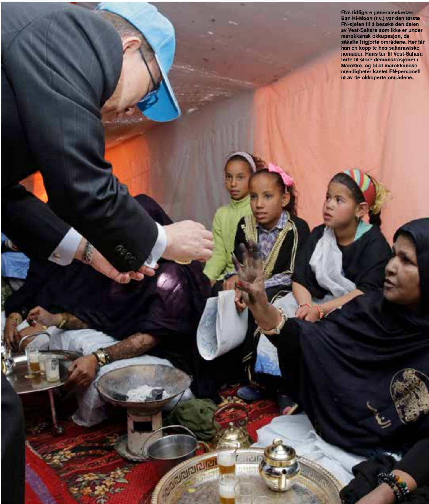
FNs tidligere generalsekretær Ban Ki-Moon (t.v.) var den første FN-sjefen til å besøke den delen av Vest-Sahara som ikke er under marokkansk okkupasjon, de såkalte frigjorte områdene. Her får han en kopp te hos saharaviske nomader. Hans tur til Vest-Sahara førte til store demonstrasjoner i Marokko, og til at marokkanske myndigheter kastet FN-personell ut av de okkuperte områdene.