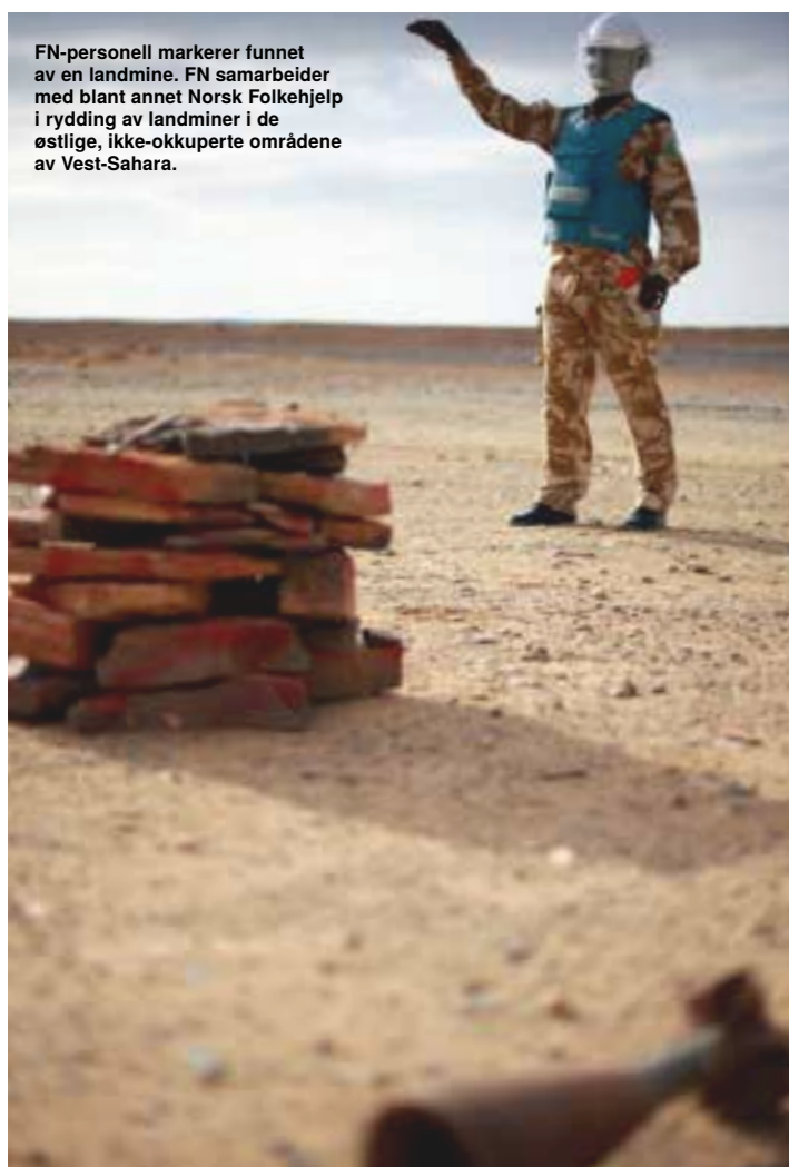
FN-personell markerer funnet av en landmine. FN samarbeider med blant annet Norsk Folkehjelp i rydding av landminer i de østlige, ikke-okkuperte områdene av Vest-Sahara.

De siste årene har viktig støtte blitt gitt fra norske myndigheter til Norsk Folkehjelp for å rydde i landminene i de østlige delene av territoriet.