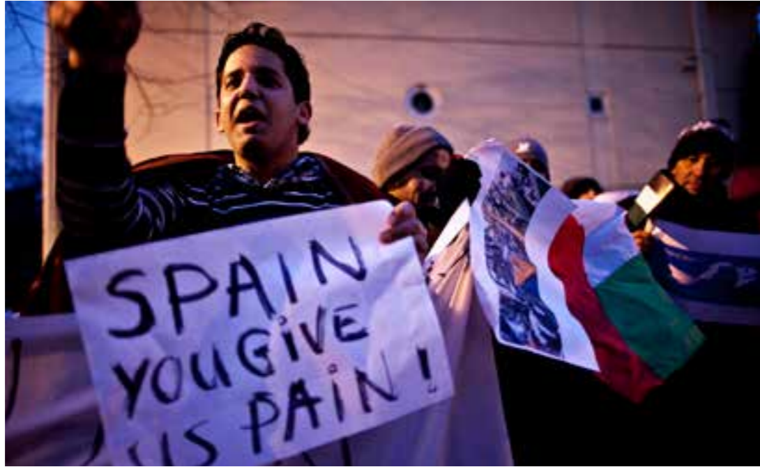
Utenfor Spanias ambassade i Oslo demonstrerer saharawiske flyktninger. Som tidligere kolonimakt i Vest-Sahara, har Spania egentlig en forpliktelse til å avkolonisere territoriet. Men de gjør det motsatte. Som en nær alliert av Marokko, er Spania delaktige i å finansiere Marokkos fortsatte tilstedeværelse i Vest-Sahara gjennom en fiskeriavtale som EU-domstolen har funnet å være i strid med folkeretten. Spania er også ett av fem land som gjennom ‘Vennegruppen for Vest-Sahara’ legger fram utkastet for de årlige sikkerhetsrådsresolusjonene.

Å forhandle fram resolusjoner i Sikkerhetsrådet krever forarbeid. For å få framgang i kompliserte saker, opprettes ofte noe som kalles Vennegrupper. Disse består av land som har tilknytning til konflikten, og normalt med en forankring i Sikkerhetsrådet.