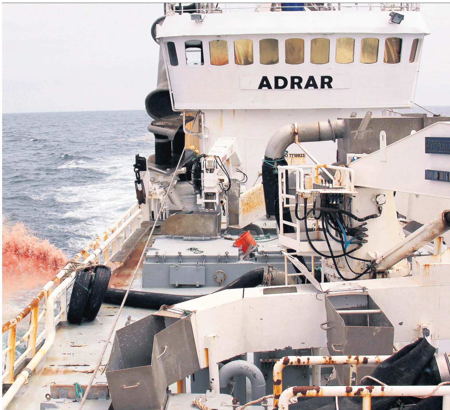
ansk og heter «Adrar», skal ha dumpet minst 1000 tonn fisk fra juli og ut året i fjor. Fisken var for liten for anleggene i Marokko.

disse rovfiskerne og taperne er kystbefolkningen og fiskerne i Vest-Sahara. Mens flyktninger fra Vest-Sahara sultet i flyktningleirer i Algerie så dumpes mat rett i sjøen. Det er forferde-