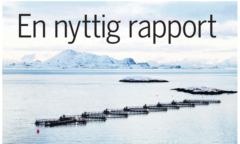
TEKNOLGI: avbruksnæringen trenger ny teknologi for å kunne gå lengre ut fra kysten. ILL.FOTO

Marin sektor trenger en velfungerende innovasjonskjede.