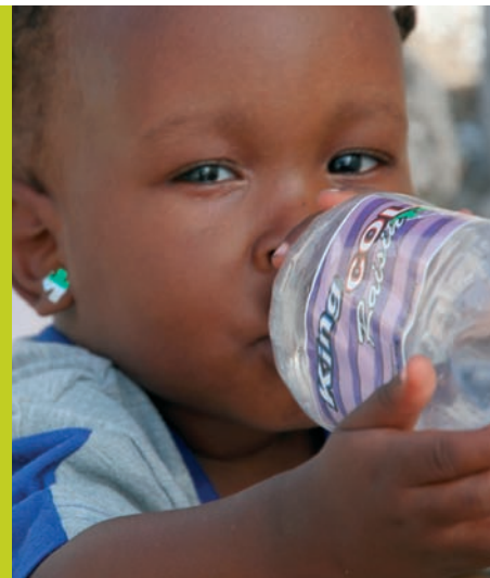
Foto: Arne Grieg Riisnæs/Kirkens Nødhjelp. Midterste nede: Arkivfoto/Kirkens Nødhjelp