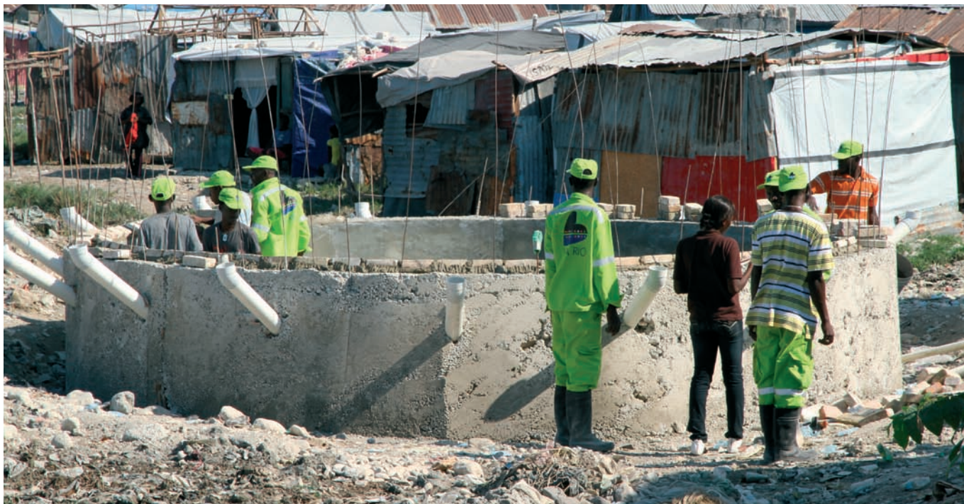
Viva Rios folk i grønne arbeidsklær bygger et nytt sanitæranlegg i området Wharf Jeremy i Cité Soleil i Port-au-Prince.